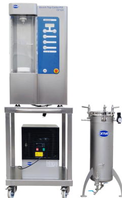
CF121 en carrito de acero inoxidable con enfriador y depósito externo de 20L

OMVE Netherlands B.V. Gessel 61 3454 MZ, De Meern The Netherlands Tel +31 30 241 00 70 sales@omve.com omve.com