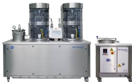
CF214 (com dois cabeçotes de enchimento) e CIP250

OMVE Netherlands B.V. Gessel 61 3454 MZ, De Meern The Netherlands Tel +31 30 241 00 70 sales@omve.com omve.com