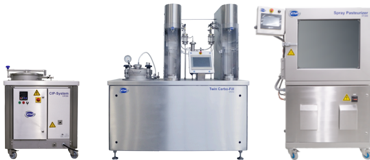
CIP350 - CF212 (con dos cabezales de llenado) - HT205 Pasteurizador por Aspersión

OMVE Netherlands B.V. Gessel 61 3454 MZ, De Meern The Netherlands Tel +31 30 241 00 70 sales@omve.com omve.com