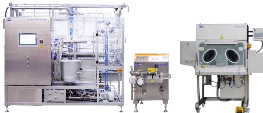
50L/hr HTST/UHT + Homogenizing + Filling

OMVE Netherlands B.V. Gessel 61 3454 MZ, De Meern The Netherlands Tel +31 30 241 00 70 sales@omve.com omve.com